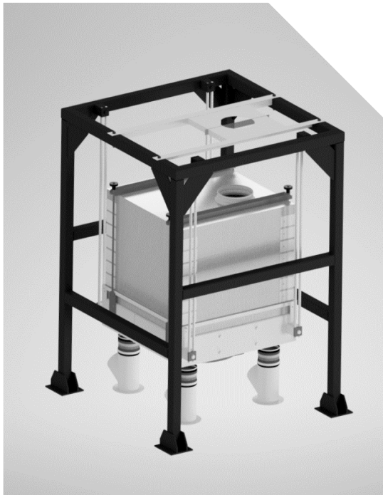
1. ábra Egyoszlopos síkszita modellje